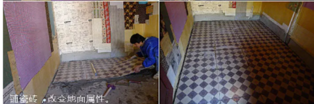
铺瓷砖，改变地面属性。