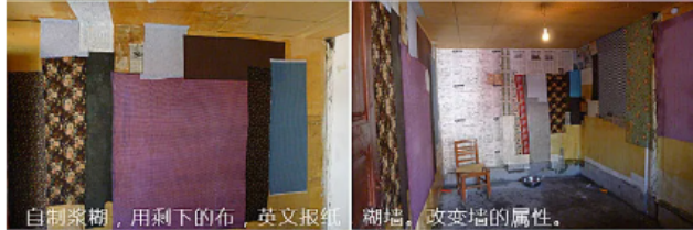
自制浆糊，用剩下的布，英文报纸，糊墙，改变墙的属性。