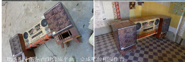
把不相干的东西组合成平面，变成吧台和操作台。

图为：菜市场示意，最好是类似这种露天菜场或当地的传统赶大集。可选择的蔬菜品质范围较广。