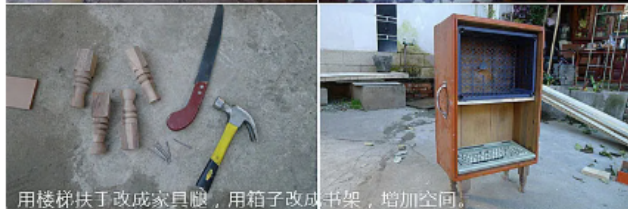
用楼梯扶手改成家具腿，用箱子改成书架，增加空间。