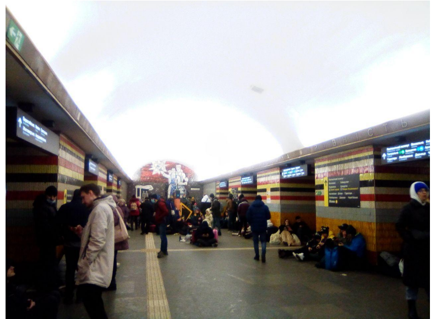
「这是现在的基辅地铁。受惊的人们聚集在地下，以避免普京政权可能发动的轰炸。」